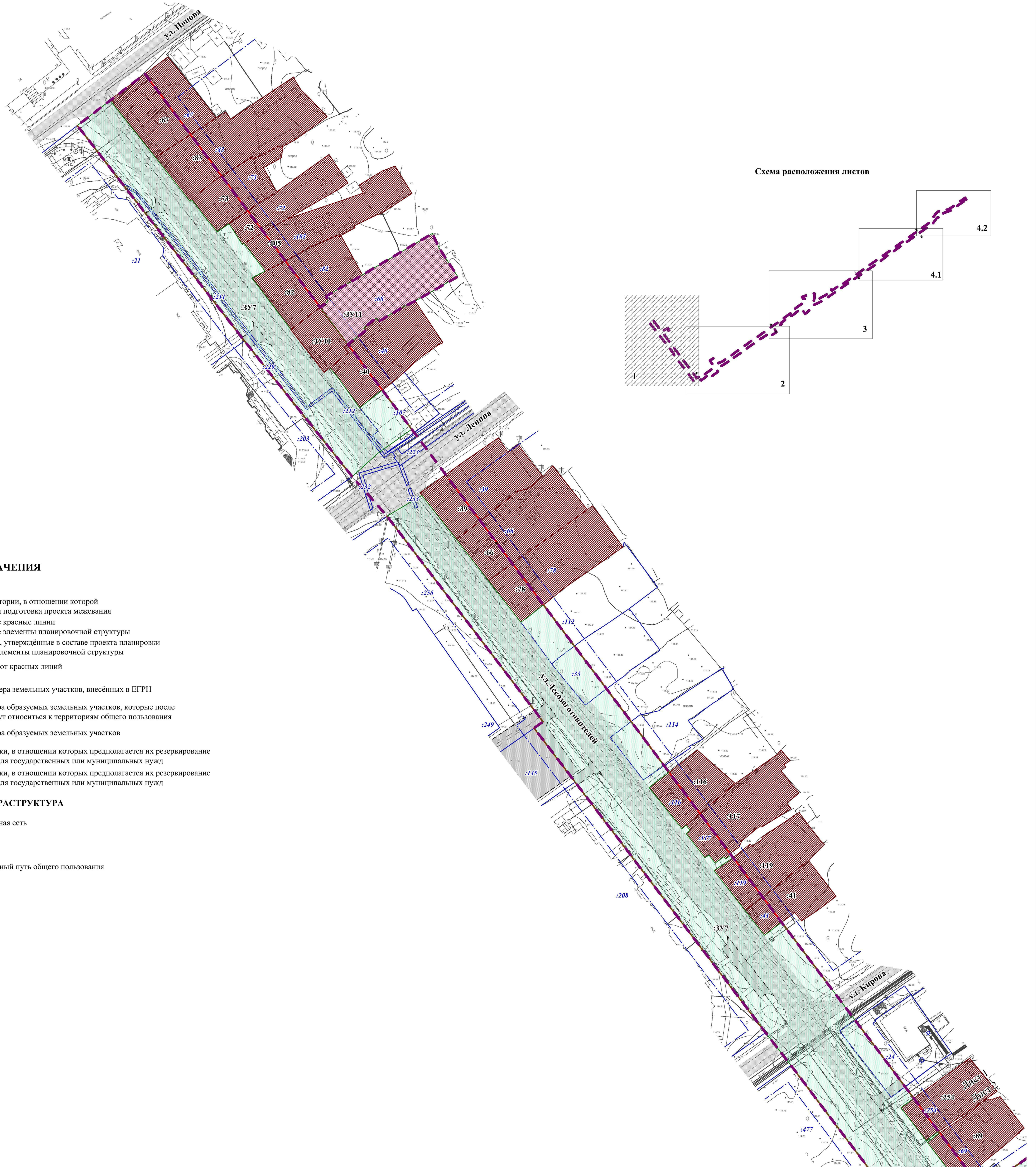
Схема расположения листов

ЧЕРТЕЖ МЕЖЕВАНИЯ ТЕРРИТОРИИ 2 ЭТАП. М 1:1000