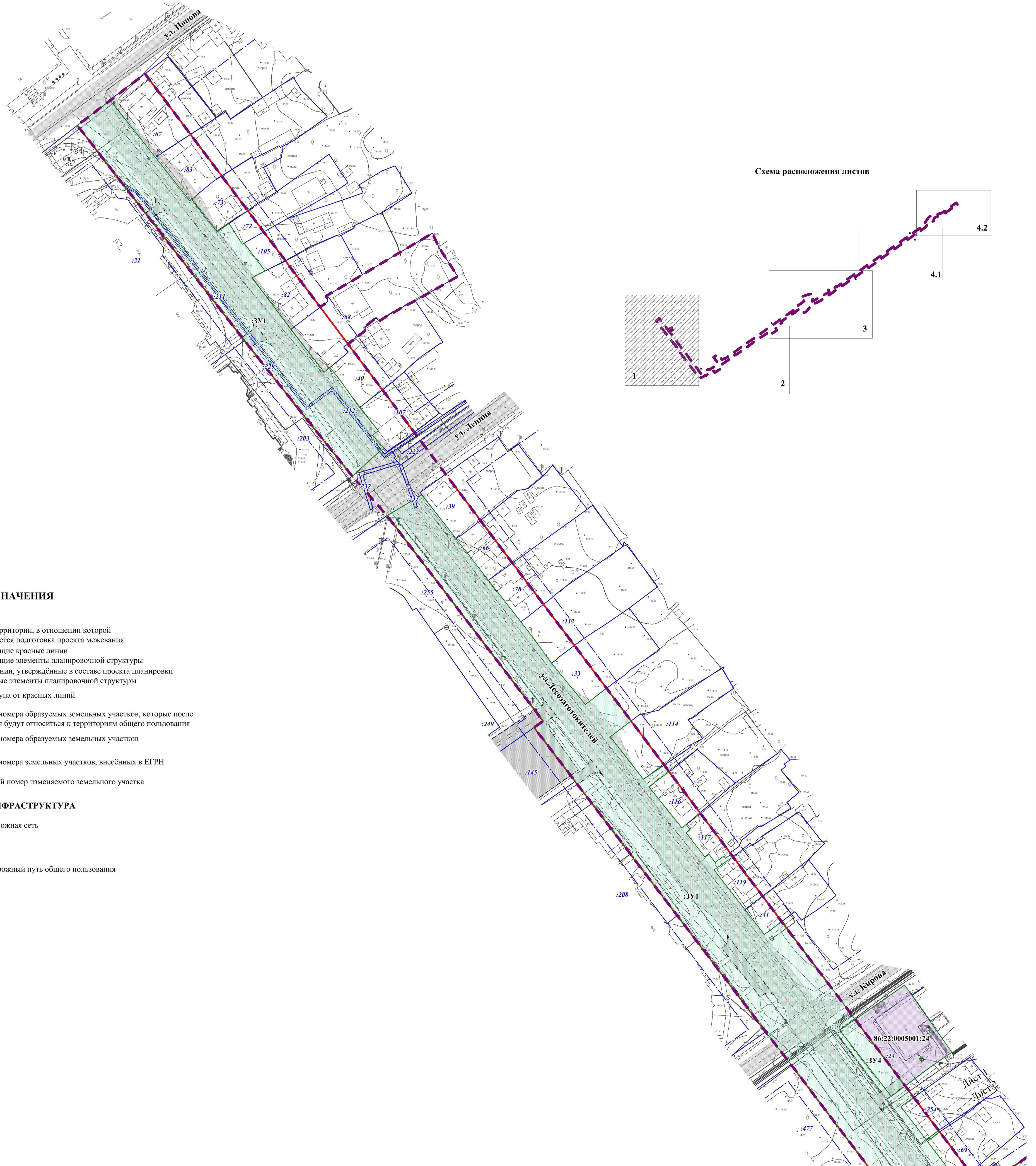
Схема расположения листов

ЧЕРТЕЖ МЕЖЕВАНИЯ ТЕРРИТОРИИ 1 ЭТАП. М 1:1000