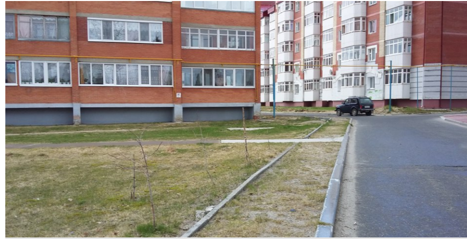
Вид на дворовой проезд