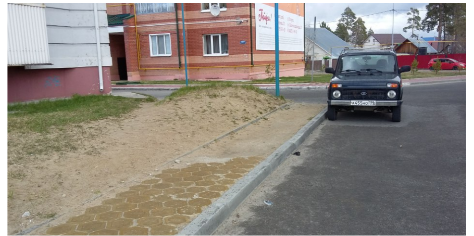
Вид в сторону улицы Студенческая