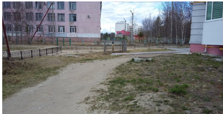
Вид в сторону школы