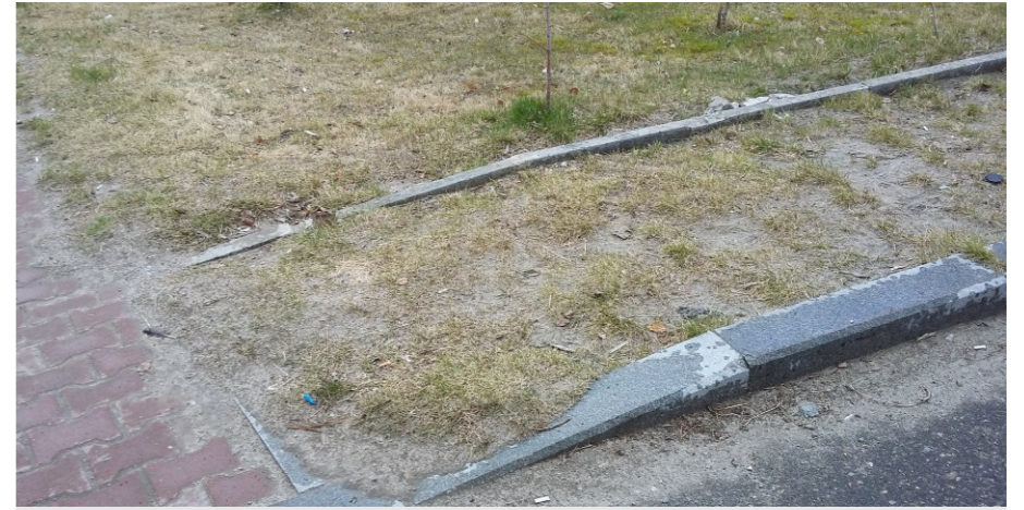
Вид на существующее покрытие