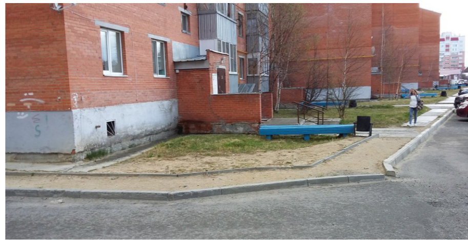
Вид на дворовой проезд