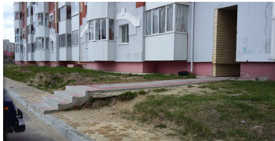
Вид на дворовой тротуар