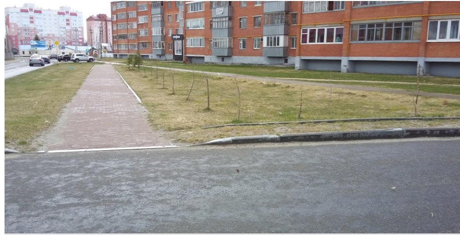
Вид в сторону улицы Садовая