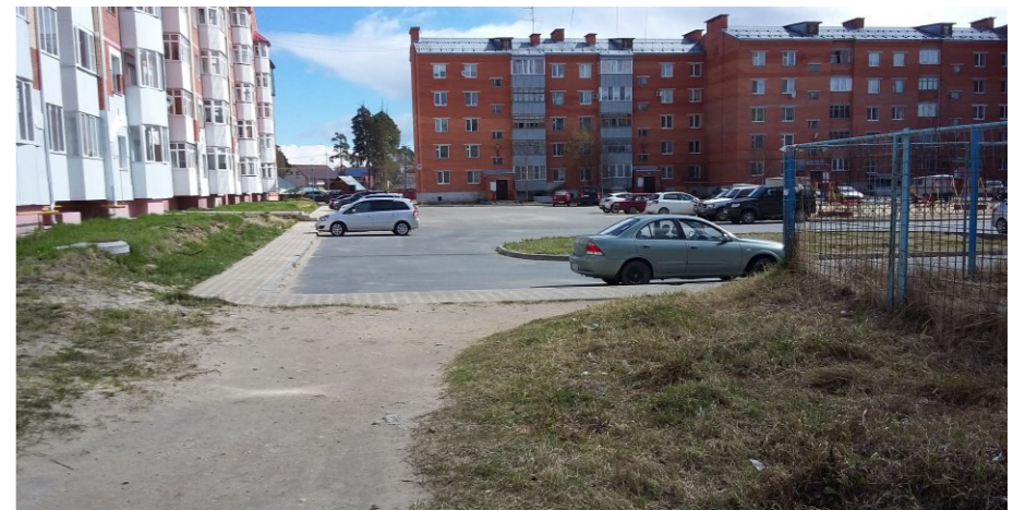
Вид в сторону улицы Студенческая