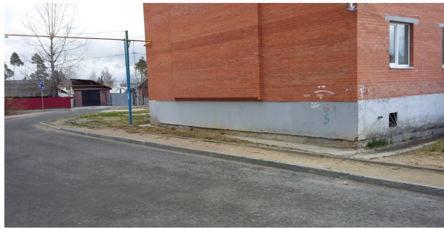
Вид в сторону улицы Студенческая