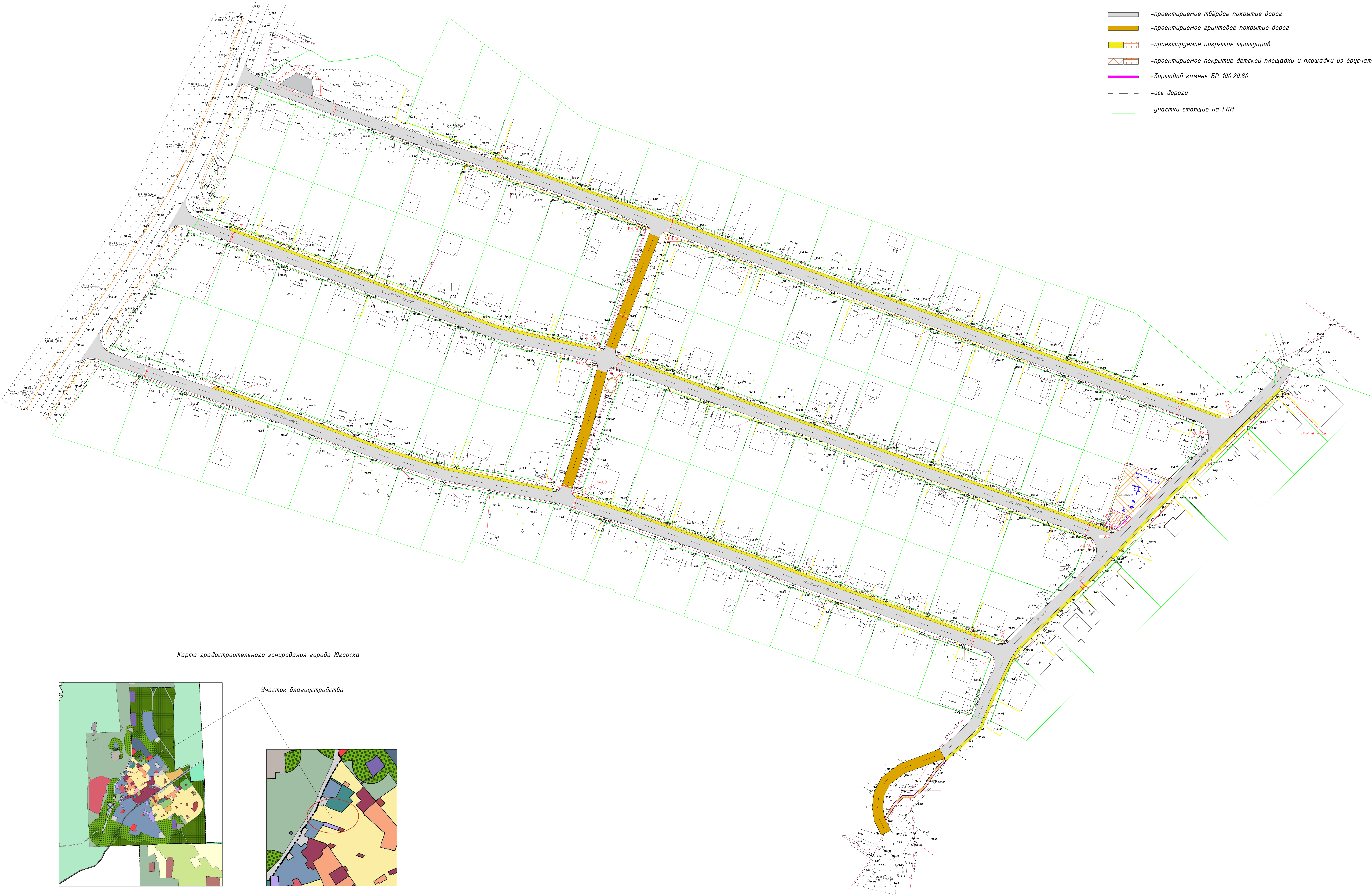
Карта градостроительного зонирования города Югорска